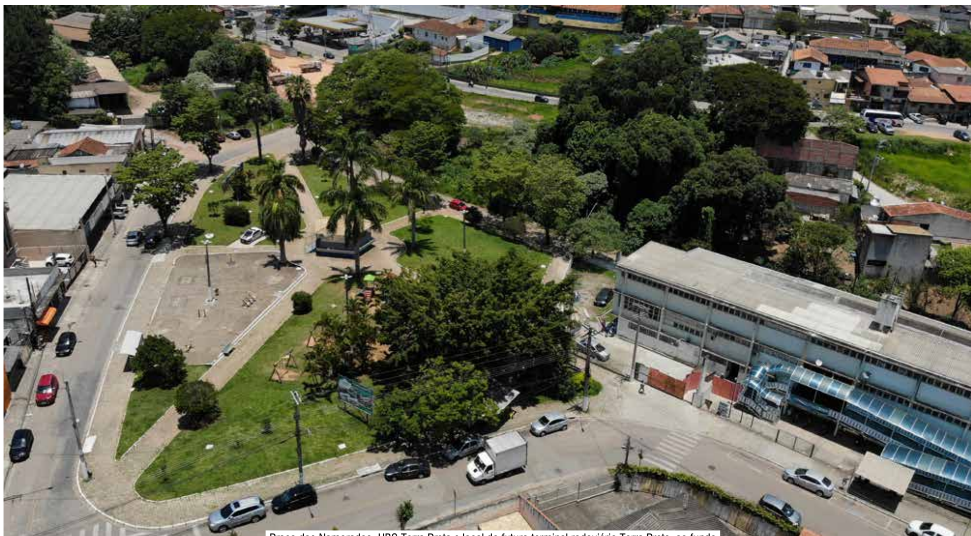
Praça dos Namorados, UBS Terra Preta e local do futuro terminal rodoviário Terra Preta, ao fundo

Recurso será destinado para obras de saúde, transporte e lazer.