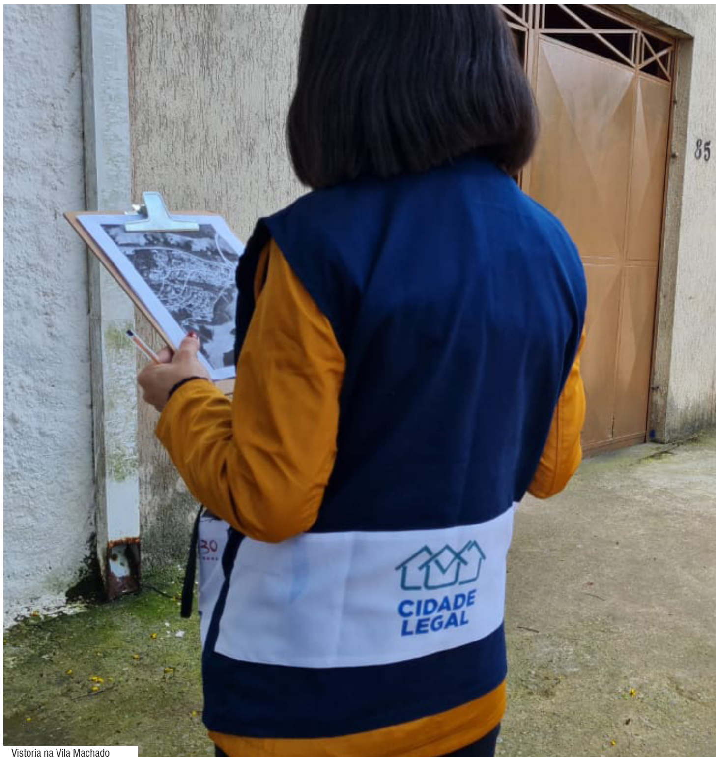
Vistoria na Vila Machado

A prefeitura tem planejado o trabalho para complementar os processos de regularização com melhorias em infraestrutura nos bairros. Entre os feitos estão a licitação para obras de drenagem na Travessa Joanina Ruffolo, no núcleo Joanina Ruffolo; licitação de drenagem e pavimentação no núcleo regularizado Chácara do Chibante e a licitação de obras de contenção de risco no loteamento Jardim Henrique Martins.