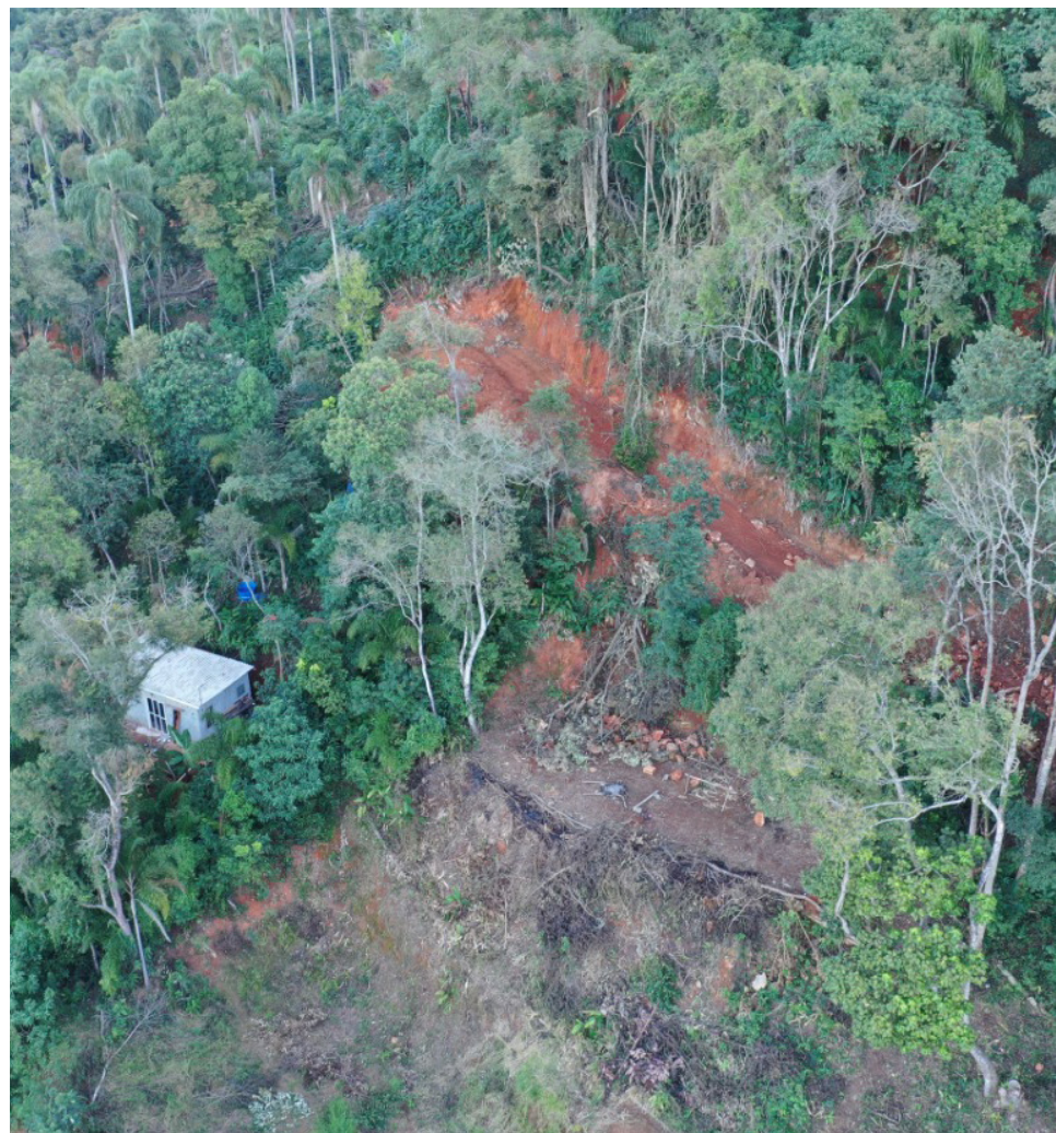
Área de desmatamento e parcelamento ilegal do solo no bairro dos Remédios

Combater Crimes Ambientais dentro de Mairiporã é uma necessidade. Denuncie situações de desmatamento, corte de árvores, construções e vendas de lotes irregulares.