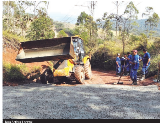
Rua Arthur Lorenzi