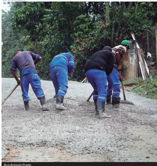
Rua Antonio Prado