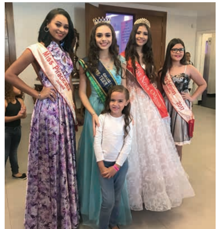
Miss São Paulo Infantil Teen, novo concurso estadual de beleza e talentos para meninas entre 4 e 17 anos