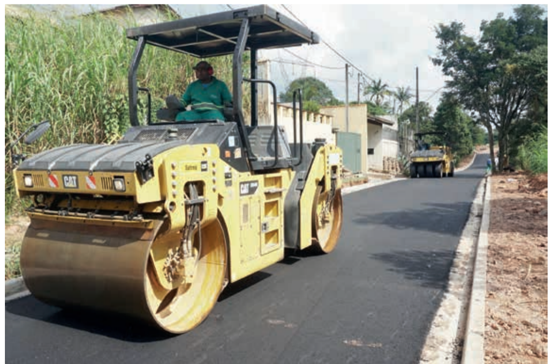
Rua Dulcinéia Arantes de Abreu, no bairro Parque da Represa