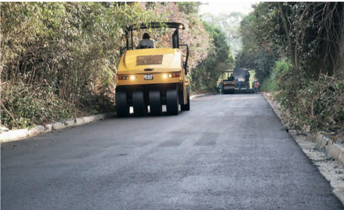
Rua Maria Nunes, no bairro São Vicente, recebeu quase 1 quilômetro de pavimentação