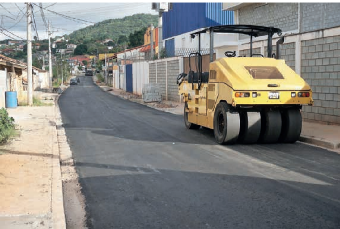
Rua São Roque, no bairro Chácara São Jorge, em Terra Preta