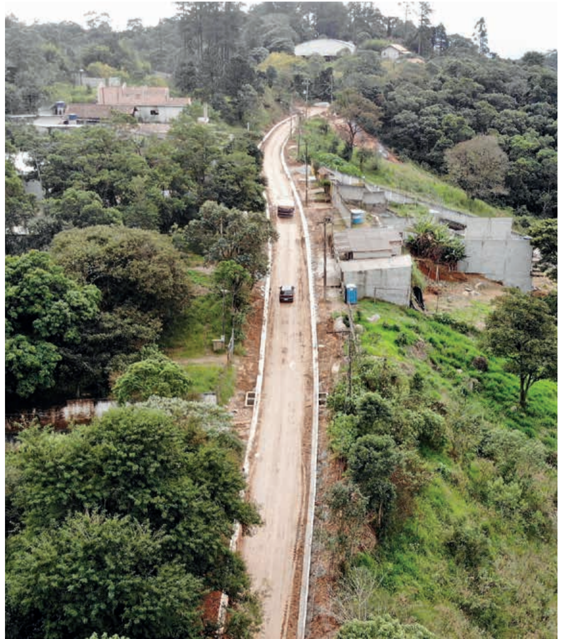
Implantação de guias e sarjetas na avenida Berna, bairro Hortolândia