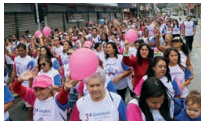
3ª Caminhada Azul e Rosa reuniu milhares de pessoas que percorreram as principais ruas do centro da cidade