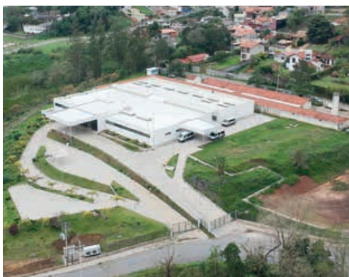
Prédio Anjo Gabriel recebe obras de adequações para implantação do AME Mais

O prefeito de Mairiporã, Antonio Aiacyda, fez questão de agradecer a visita dos representantes vizinhos. "Eu quero agradecer a todos os prefeitos e secretários vieram até aqui para conhecer o prédio. Permanecemos juntos lutando para que se concretize a implantação do AME o mais rápido possível. Vamos trazer para Mairiporã um AME para que as pes-