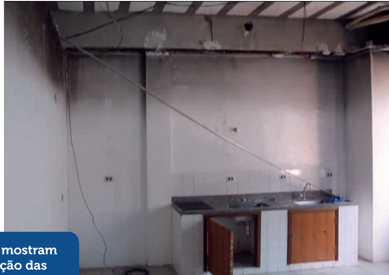
As fotos mostram a situação das dependências internas do prédio do Centro Educacional no início de 2017