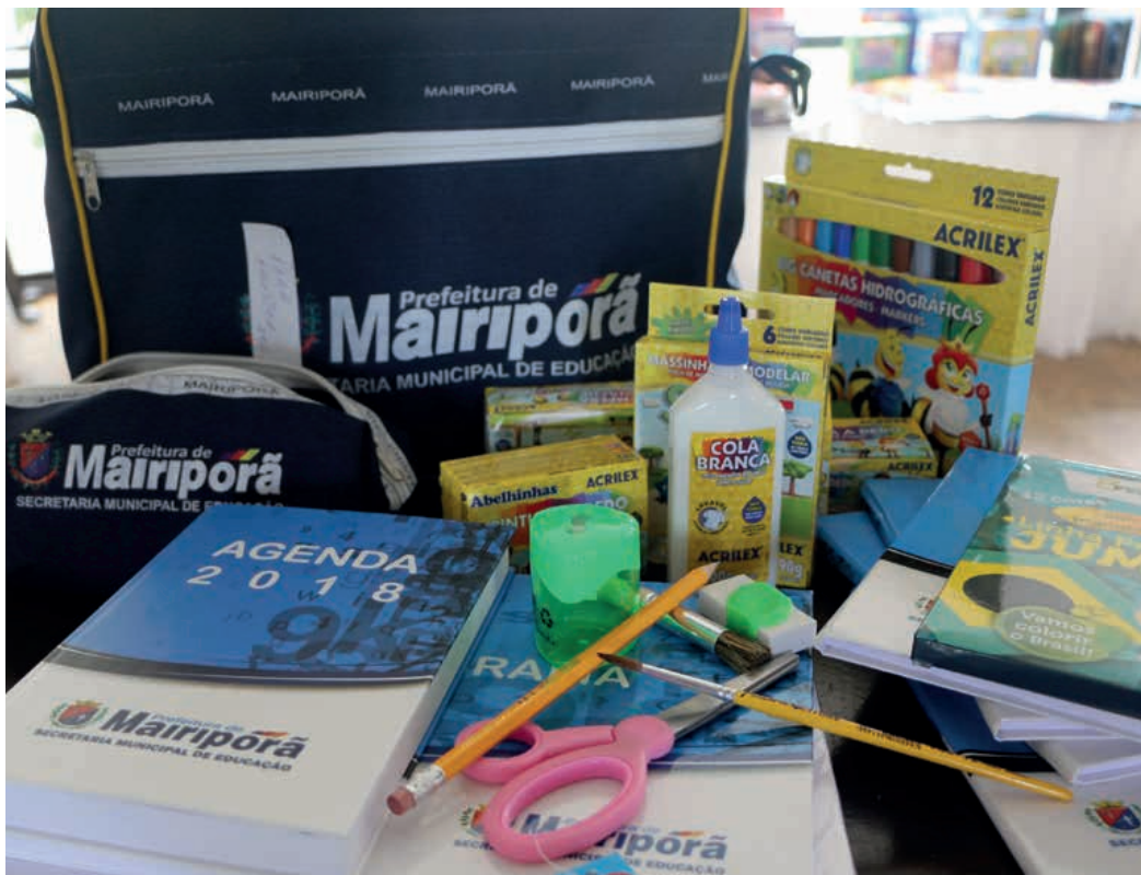
Neste início de ano letivo, em 2018, a Secretaria entregou todo o material escolar necessário aos alunos e às escolas

Para os professores, a Secretaria forneceu uma vasta quantidade de material didático para ser trabalhado em sala de aula.