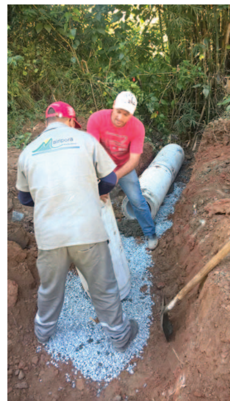
A prefeitura realizou obras para a colocação de tubos de drenagem de águas pluviais na Rua Benedicto Antonio da Silva, bairro Jundiaizinho. A rua também recebeu serviços de manutenção e patrolamento. A obra é fruto da parceria entre a comunidade e a prefeitura.