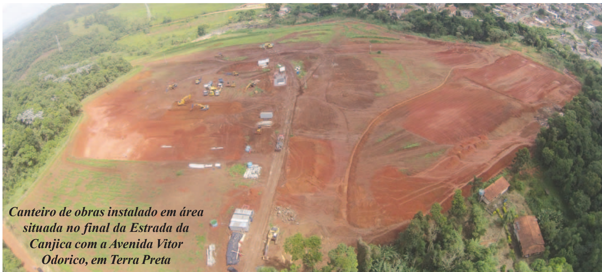
Canteiro de obras instalado em área situada no final da Estrada da Canjica com a Avenida Vitor Odorico, em Terra Preta

Mais de mil pessoas já fizeram as inscrições para o Programa Minha Casa Minha Vida de Mairiporã, cujas obras já foram iniciadas em área situada no final da Estrada da Canjica com a Av. Vitor Odorico, em Terra Preta.