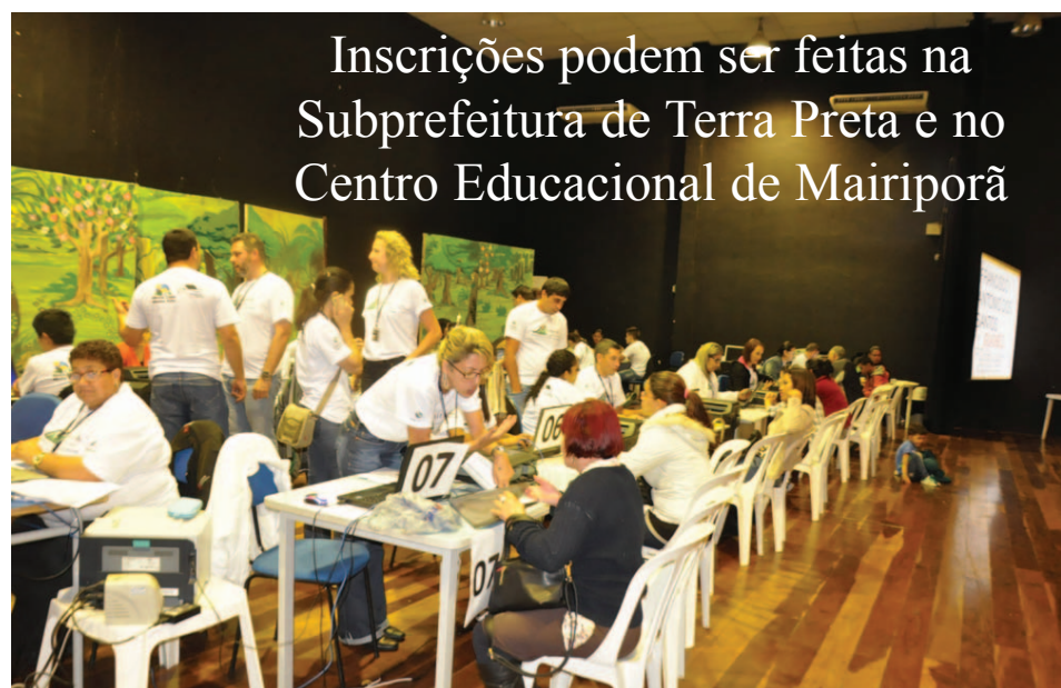
Inscrições podem ser feitas na Subprefeitura de Terra Preta e no Centro Educacional de Mairiporã

Mais informações pelo telefone: 4419-8048 ou no site da prefeitura www.mairipora.sp.gov.br